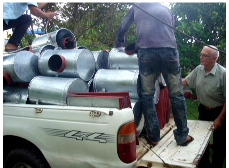
Il les disséminera dans les communautés de la campagne, dont il promeut le développement