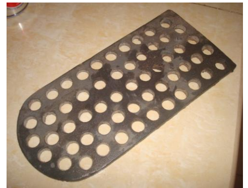
Grille en fonte, plus durable

Faible consommation de bois. Chaleur concentrée. Très peu de fumée. Cuisson rapide, saine et confortable.