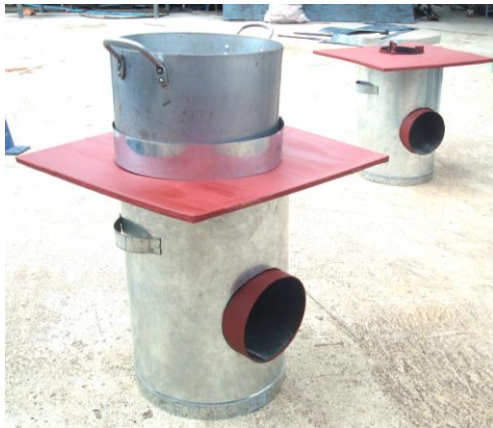
Détail de réalisation et quelques vues sur le cuiseur